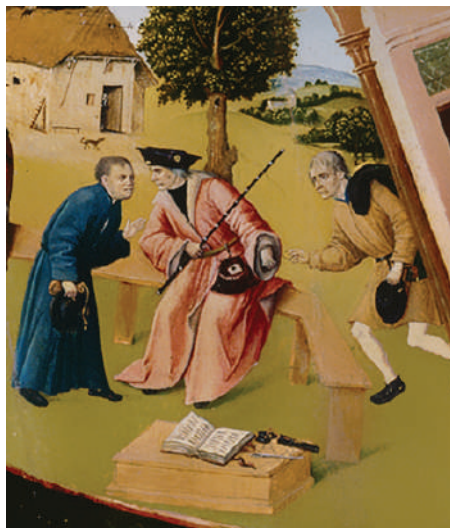
Фрагмент «Алчность» картины Иеронима Босха «Семь смертных грехов»

Рассматривая участников коррупции на примере взяточничества, стоит отметить, что в коррупционном процессе всегда участвуют две стороны. Одна сторона — это взяткополучатель (подкупаемый). Вторая сторона — это взяткодатель (осуществляющий подкуп). Также в процессе может участвовать и третья сторона — посредник.