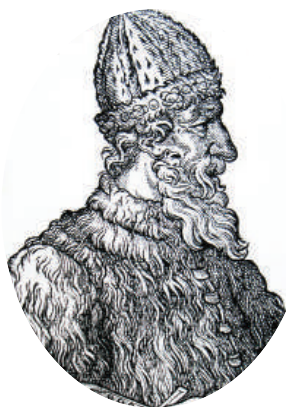
Великий князь Иван III

До XVIII века чиновники на Руси жили благодаря так называемым «кормлениям», то есть, при отсутствии оклада за исправление должности, разрешению на подношения от заинтересованных в их деятельности лиц. Одаривали их не только деньгами, но и «натурой» — мясом, рыбой, пирогами и пр., что было делом обыкновенным.